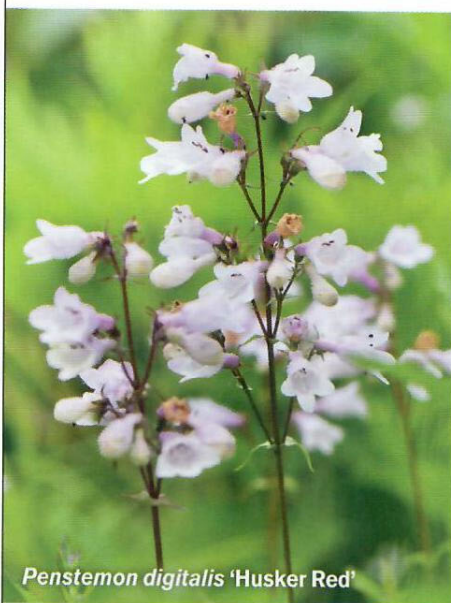
Penstemon digitalis 'Husker Red'

• Penstemon strictus . Diep paarsblauwe bloemen aan circa 60 cm hoge stengels. Bloeit van einde voorjaar tot ver in de zomer. De bladeren zijn donkergroen, ook in de winter blijft de plant lang groen. Houdt van volle zon, maar kan desnoods ook in de halfschaduw. Komt van oorsprong onder andere in de Rocky Mountains voor op 2.000-3.250 meter hoogte. Vandaar de Nederlandse naam Rocky Mountainpenstemon. Kan goed tegen droogte.